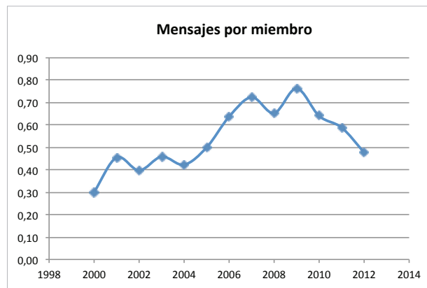
Figura 3. Evolución de la participación en la lista lweTel (2000-2012)

El decrecimiento que se percibe a partir de 2010 (ver figura 3) se debe por un lado a que los moderadores son más estrictos para aprobar mensajes que consideran que no son de interés