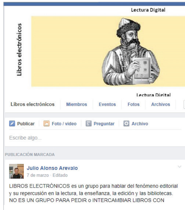
Grupo Libros electrónicos en Facebook https://www.facebook.com/groups/universoebook