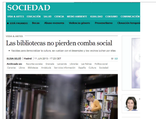
Figura 2. Artículo "Las bibliotecas no pierden comba social" (E. Silió, El país , 11 junio 2013)

La visita de un bibliotecario joven de la Biblioteca Pública de Brooklyn a España en 2013 trajo