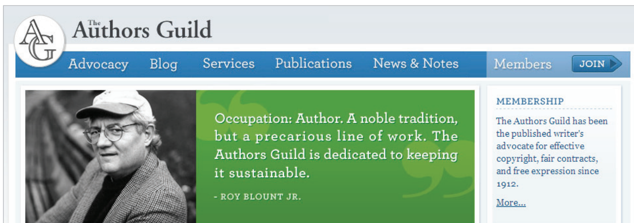
Figura 3. The Authors Guild https://www.authorsguild.org

En agosto de 2013 la Ifla aprueba su Declaración sobre bibliotecas y desarrollo (Ifla, 2013) , en la que se afirma que "el acceso a la información es un derecho humano básico que puede acabar con el ciclo de pobreza y apoyar el desarrollo