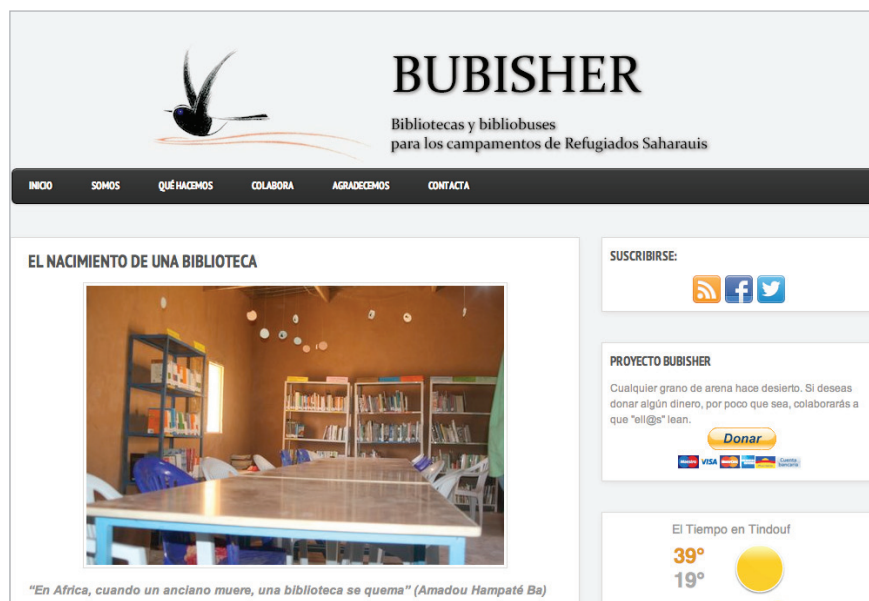
Figura 6. "El nacimiento de una biblioteca" (Bubisher, 2013) http://www.bubisher.org/2013/05/4037.html

botellones no son botellones, por mucho que se incorpore el nombre al título y este intento de emulación puede ser contraproducente.