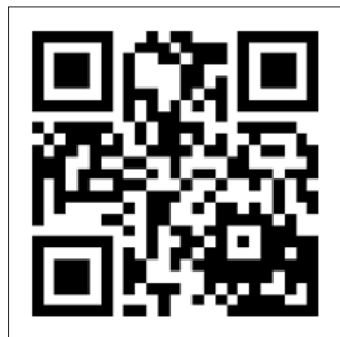
Figura 3. QR con datos personales http://bit.ly/thinkepi-qr2

Veamos un ejemplo más cercano a las bibliotecas: un libro. A cualquiera de los que tenga en la estantería puedo pegarle un código QR de tal modo que un usuario pueda obtener en el momento información completa más allá de la que le ofrece el propio libro. Creo una pequeña página web en la que añado la información que me parezca oportuna (y que como ya he comentado voy a poder actualizar cuando sea necesario). Un código que hace eso mismo y que podríamos