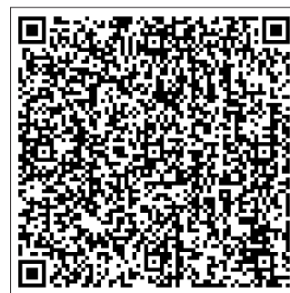
Figura 1. Código QR

El código QR puede seguir siendo el mismo y puedo usarlo allí donde quiera. Puedo ofrecer información actualizada sobre mí y sobre lo que hago en cualquier momento. Si incorporo el código a todas mis publicaciones (electrónicas o en papel) y voy actualizando el espacio de destino, alguien que lea en 2015 un artículo que haya escrito en 2011