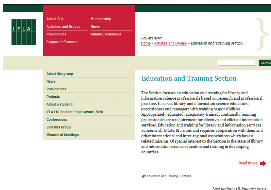
Figura 3. Ifla. Education and Training Section, http://www.ifla.org/en/set

Junto a la definición más abierta del perfil profesional que tiene su reflejo en el cambio de denominación, el nuevo título se juega en buena medida su credibilidad en el establecimiento de perfiles de formación basados en competencias. Este enfoque exige un aprendizaje centrado en un trabajo del alumno que combine de forma adecuada la teoría y la práctica. Pero esta nueva orientación es más fácil de redactar en las memorias de verificación de las titulaciones