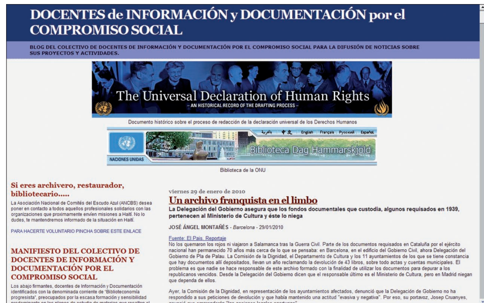
Figura 3. Blog del Colectivo de Docentes de Información y Documentación http://ldocentesdocumentacioncompromiso.blogspot.com/

Así, uno de los temas reiterativos en los debates de nuestra profesión es nuestra denominación. En 2009 señalamos dos iniciativas en este sentido que han provocado de nuevo la discusión en nuestro colectivo. La primera de ellas, se produce en el marco del documento L'horitzó professional