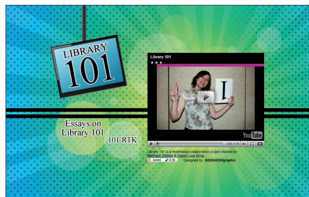
Figura 2. Library 101, http://www.libraryman.com/library101/