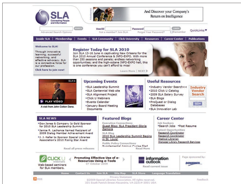
Figura 4. Special Libraries Association (SLA) , http://www.sla.org/

Participaron 832 profesionales, con 200 ponentes y se desarrollaron 45 actividades divididas entre ponencias, paneles de expertos,