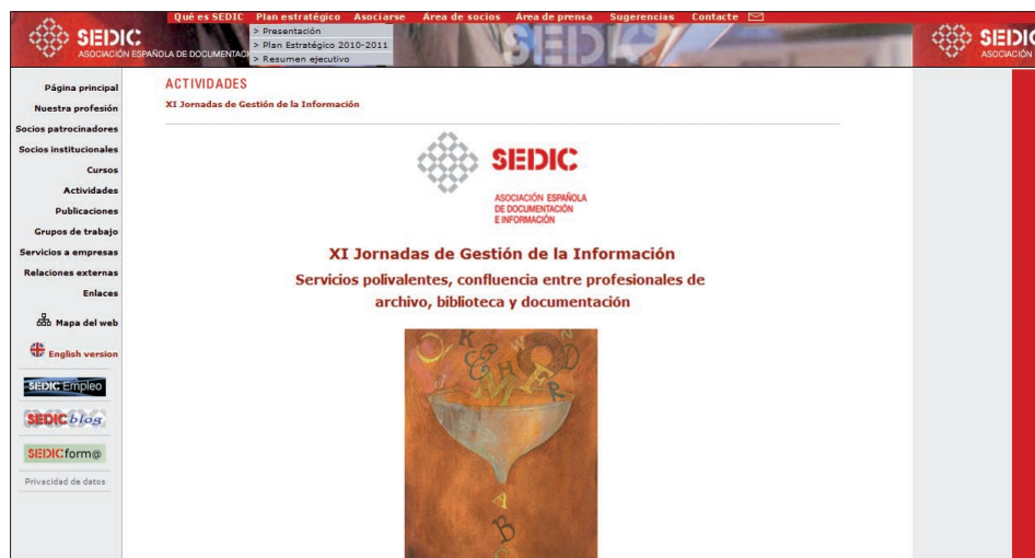
Figura 2. Jornadas Sedic 2009, fuente: http://www.sedic.es/

científicas. Se trata de los estudios bibliométricos (curiosamente una materia en la que en España existen varios grupos de investigación), de las bases de datos documentales, o de la gestión del conocimiento. En algunos casos se trata de especializaciones que disponen de congresos internacionales. En tecnologías de la información existían las Jornadas de bibliotecas digitales, JBiDi (5ª ed., Granada, septiembre 2005) y las Jornadas de tratamiento y recuperación de información, Jotri (2ª ed., UC3 de Madrid, septiembre 2003), que en parte parecen haber sido absorbidas por las actividades de Rebiun .