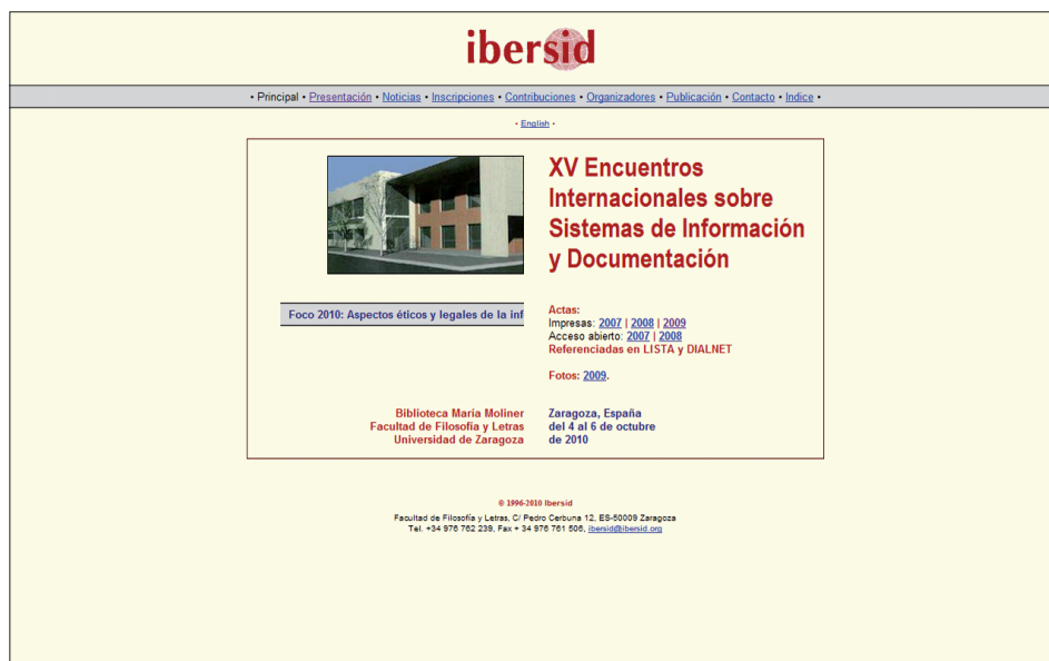
Figura 4. Ibersid

A partir del análisis de las principales reuniones científicas que se llevan a cabo en España podemos agrupar las afinidades temáticas más