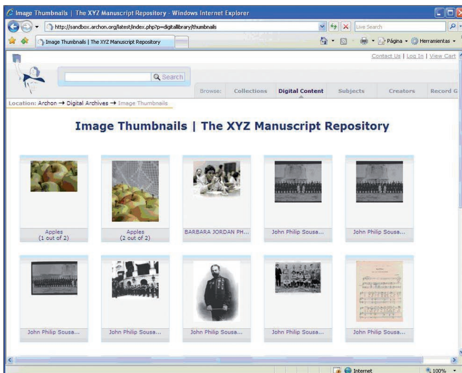
Figura 2. Archon

7) Acceso web, donde se reúnen requisitos relativos a la capacidad para publicar contenidos y dar servicios a través de la Web. Especifica contenidos de la página home , opciones para la búsqueda, hiperenlaces que deben estar disponibles para explotar las relaciones entre los dis-