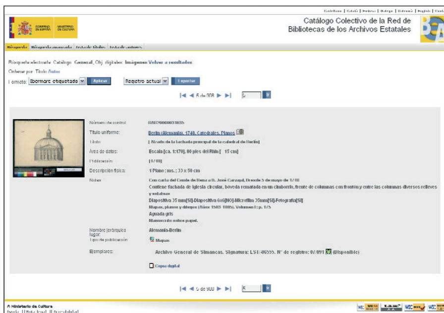
Registro digital del alzado de la fachada de la catedral de Berlín que se conserva en el Archivo General de Simancas. Catálogo Colectivo de la Red de Bibliotecas de los Archivos Estatales ( http://www.mcu.es/ccbae/es/consulta/busqueda.cmd ).

Así como por estas nuevas funcionalidades (manejo de imágenes, de forma potente pero simple, o recuperación textual, de forma ágil pero sofisticada), Digibis apuesta también, con fuerza, por los métodos normalizados que permiten el acceso a la información en la red así como la máxima visibilidad en la misma, fundamentalmente mediante el pro-