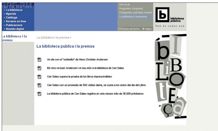
Dossier de prensa de la biblioteca pública de Palma de Mallorca