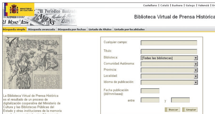
Biblioteca Virtual de Prensa Histórica

Los colegas de la Biblioteca Pública de Badajoz, que han participado en el proyecto anterior, subrayan que, a pesar de su interés, el estado del equipamiento informático y de comunicaciones de los centros en algunos casos puede dificultar un óptimo aprovechamiento, por lo que han valorado más positivamente sus experiencias de colaboración con la Biblioteca Nacional, cuyo resultado ha sido la digitalización en CDs y DVDs de los diarios Hoy y El periódico Extremadura. La Hemeroteca digital es la denominación del ambicioso proyecto de digitalización iniciado