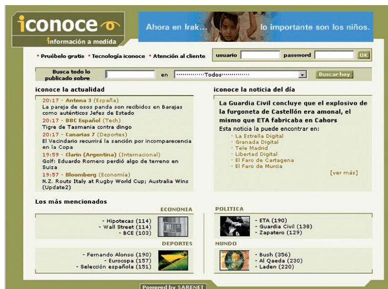
El servicio de información de prensa iConoce

de prensa entre el alumnado del curso son de iConoce y Factiva.