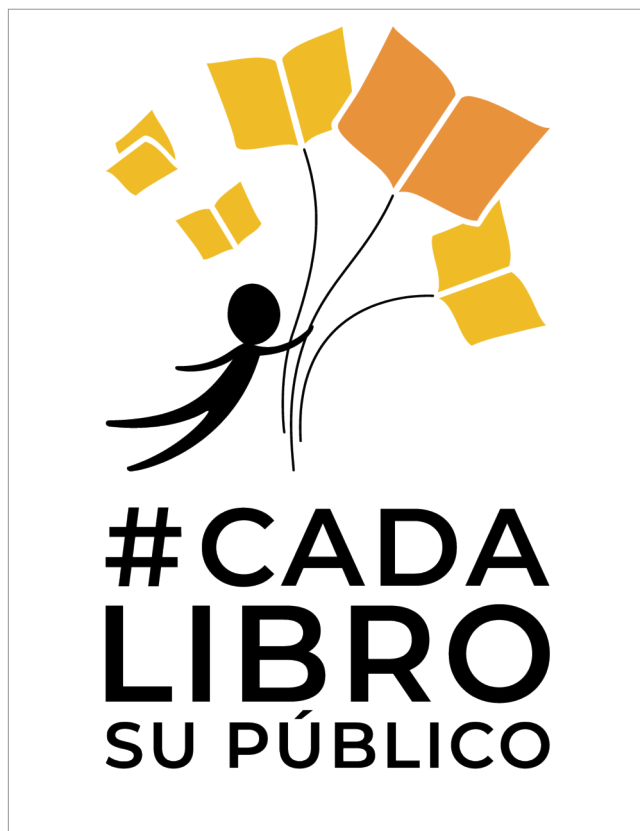
Figura 2. Cartel de la campaña “Cada libro su público”

Todo esto es también faena genuinamente bibliotecaria. Escribir o enriquecer un artículo de enciclopedia es más exigente que una microinteracción en una red social, o una reseña en una librería online. Es un trabajo intermedio. No requiere pertenecer a la academia, sino más bien adoptar la posición