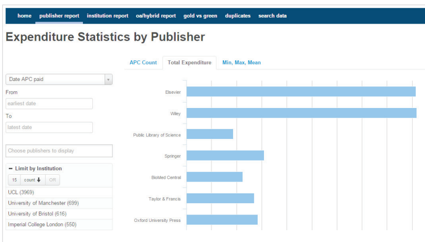
Número de APCs pagadas por la universidades británicas a las editoriales http://apc.ooz.cottagelabs.com/report/publisher

Este es un aspecto en el que resta bastante trecho aún por recorrer: la mayor parte de los pagos de APCs por parte de los autores se costean en la actualidad de manera completamente independiente y opaca para la institución a la que pertenecen, con cargo a las asignaciones de proyectos y sin que medie notificación de ninguna clase a un sistema centralizado de gestión de la información científica, en marcado contraste con ámbitos como el de las publicaciones en sí. Esto es en parte debido a que, pese a los progresos habidos recientemente, ningún sistema