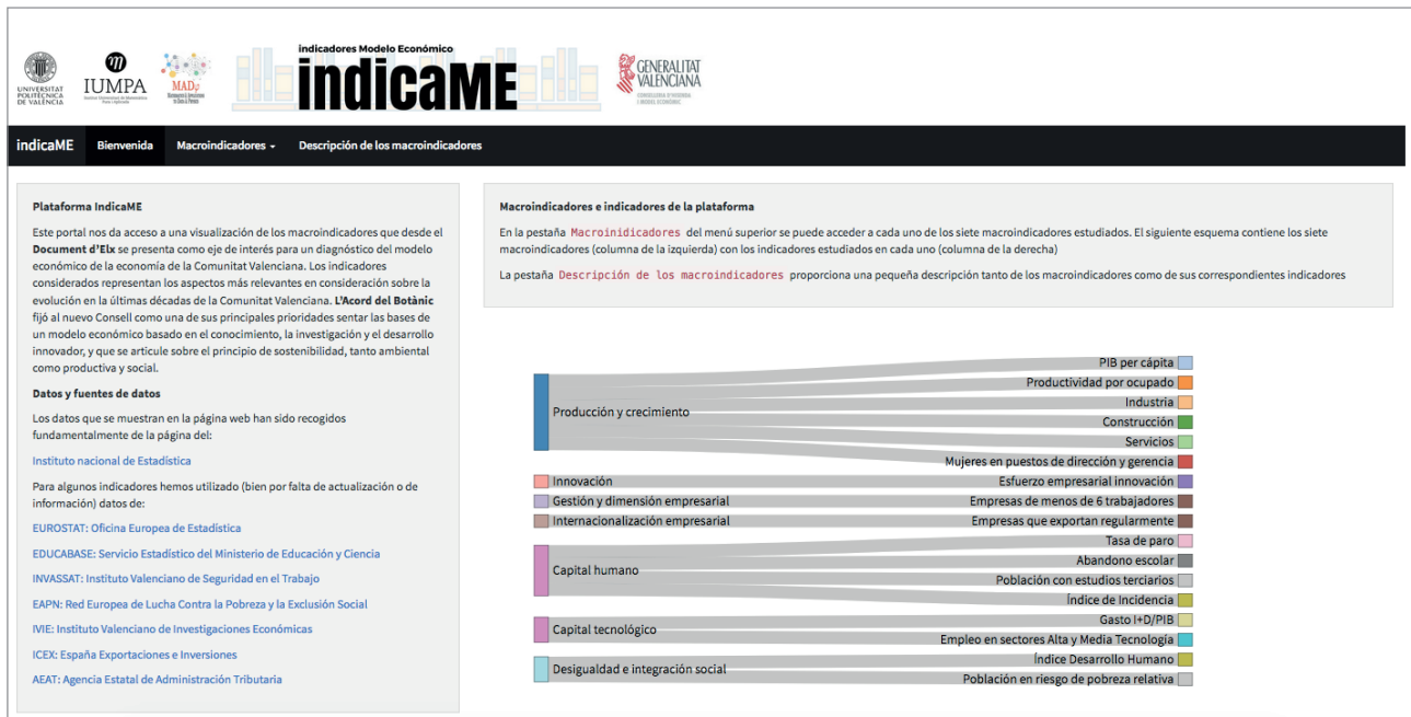
Figura 2. Pantalla de bienvenida del portal indicaME

de la página del INE . El motivo fundamental de esta elección no se debe sólo a su fiabilidad y accesibilidad sino porque proporciona una API que, estructurada mediante peticiones de URL (vía el conocido formato JSON), permite la obtención tanto de datos como metadatos para la explotación automática de sus datos estadísticos. http://www.ine.es/dyngs/DataLab/manual.html?cid=45